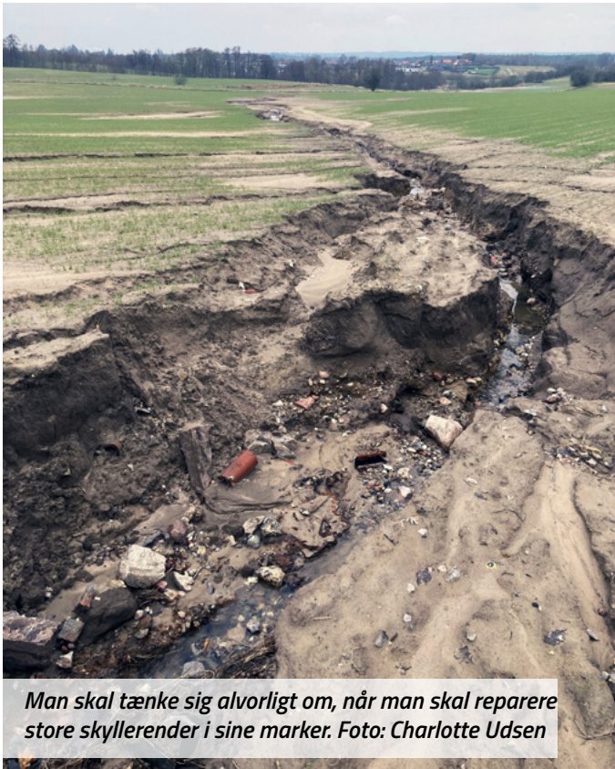
Man skal tænke sig alvorligt om, når man skal reparere store skyllerender i sine marker.

miljøforbedrende tiltag og færre næringsstoffer i den store fynske fjord, uden nævneværdige "gener" for landmændene i oplandet. Torbens fortælling var meget inspirerende, så præsentationen affødte mange spørgsmål, specielt om den fynske landboforenings meget proaktive deltagelse i samarbejdet.