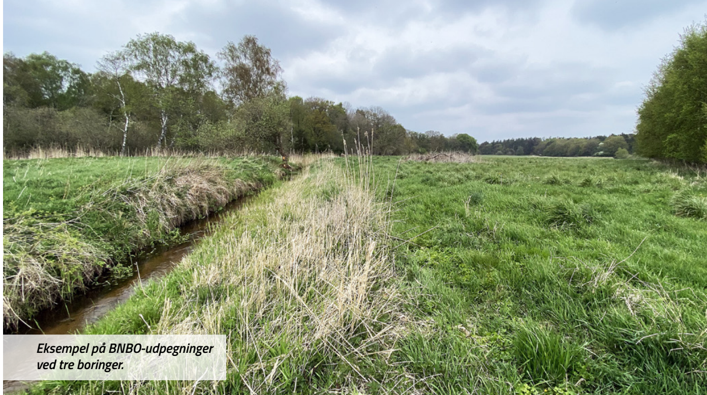
Eksempel på BNBO-udpegninger ved tre borerger.