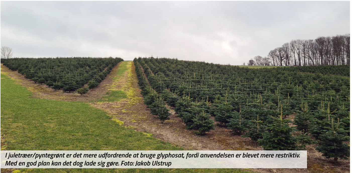
I juletræer/pyntegrønt er det mere udfordrende at bruge glyphosat, fordi anvendelsen er blevet mere restriktiv. Med en god plan kan det dog lade sig gøre.

De rekordstore nedbørsmængder, som vejrguderne har budt på lige fra høst og langt ind i februar, har sat sit præg på vintersæd og raps. Større eller mindre områder af rigtig, rigtig mange marker har været oversvømmet så længe, at afgrøderne ikke har kunnet klare sig igennem vinteren. Mange steder bliver der sået i, eller om.